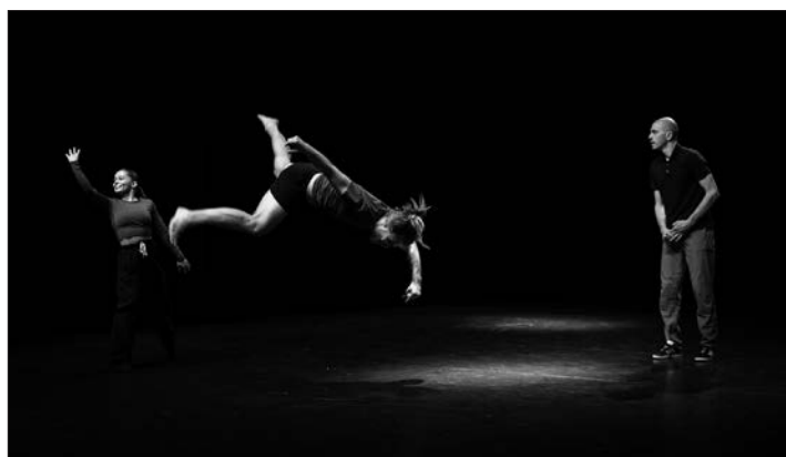
Dans- och akrobatikföreställningen "The Odd Ones" på Folkets hus blev en publikframgång. Bilden togs vid belgisk premiär på Perplx Vitrine.